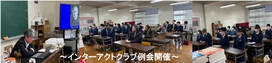
～インターアクトクラブ例会開催～