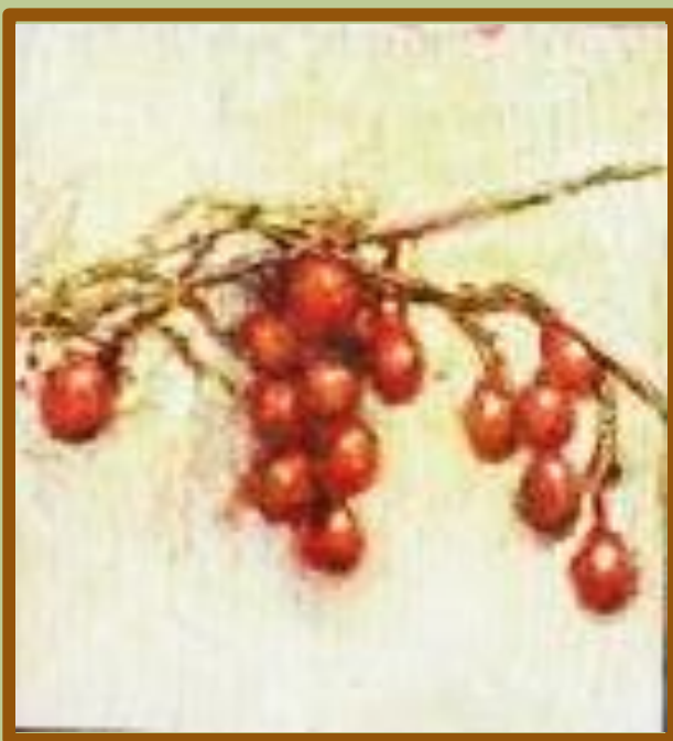
画題: 或る果実 原 信之 画伯作