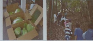
心の中に平和のとおりで! ボナペティ事務局長 田町菜穂子2024.4.4