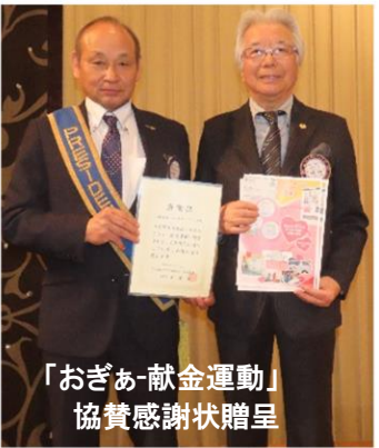
「おぎあ-献金運動」 協賛感謝状贈呈