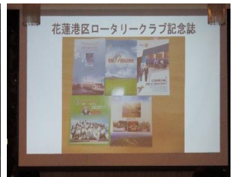
「花蓮 RC との姉妹クラブの経緯について」